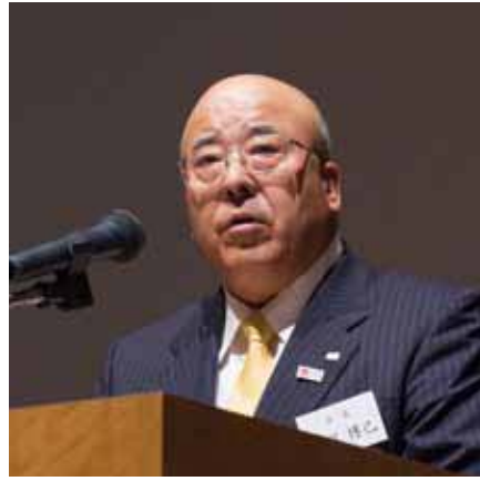
田川会長「私たちの力の原点の再認識を」