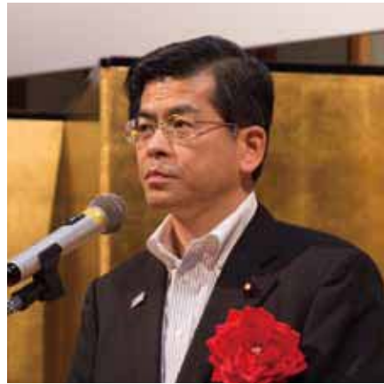
石井大臣「1日も早い復旧・復興へ全力尽くす」