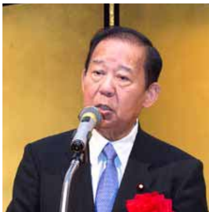
二階俊博会長「被災地を訪ね観光の重要性を再認識した」