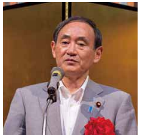
菅官房長官「2020年に向けて旅行業界も協力を」