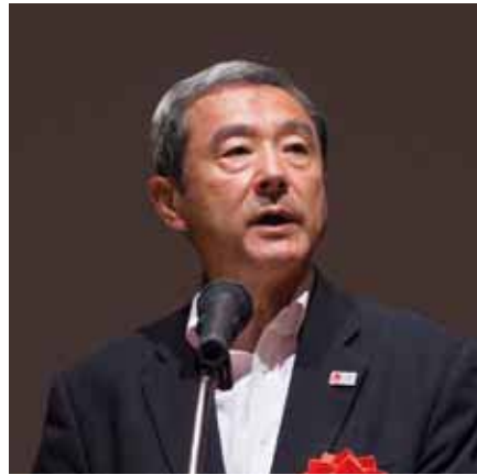
田村長官「海外・国内・訪日で魅力ある商品を」