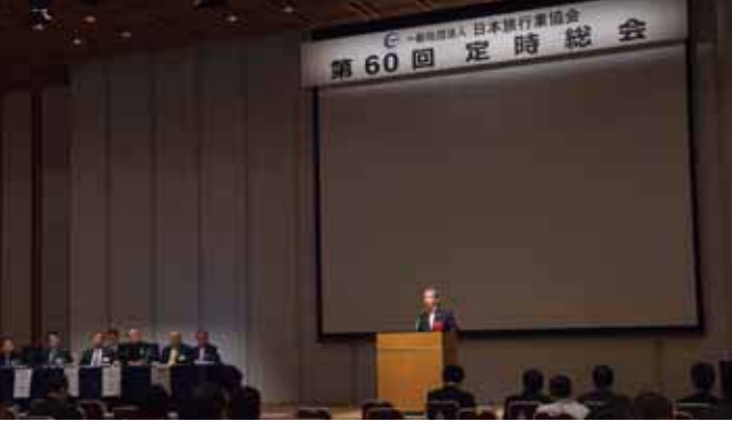
第60回 JATA 定時総会には125社が出席。委任状提出の804社と合わせ、6月20日現在の正会員1166社中929社の出席により、総会が成立しました