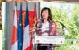
オクシタニー地方圏議会議長のデルガ氏