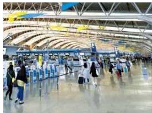
ツアーセーフティネットでは出発前から安全情報を配信

JATAは今年6月30日付『朝日新聞』朝刊紙面の広告特集『ポータルシエに、「海外パッケージツアーの安全と安心を再認識！」というタイトルで広告出稿し、JATAが定めた「旅の安全の日」(7月1日)をアピールするの日に、旅行会社の企画する募集型企画旅行(パッケージツアー)と同時に、「旅の安全と安心」を「何より