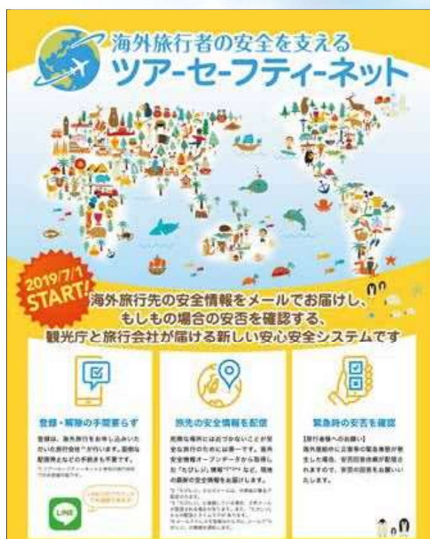
ツアーセーフティネットの利用促進を呼びかけるポスター

での海外安全情報の提供や安否確認を行えるプラットフォームとしてツアーセーフティネットの運用を開始し、旅行業界全体で安心して海外旅行ができる環境を整えていきたい考えです。