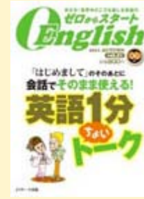
『ゼロからスタート English』

http://www.jresearch.co.jp/isbn978-M-3215-0027-0/