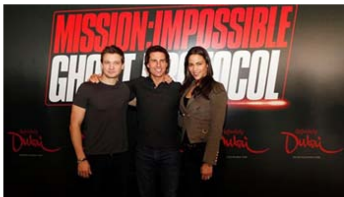
『ミッション：インポッシブル／ゴースト・プロトコル』（原題）の制作発表はアルマールニ・ホテル・ドバイにて

ドバイで撮影された『ミッション：インポッシブル／ゴースト・プロトコル』 12月16日、いよいよ公開！