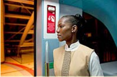
メトロ車内にいるインスペクター。 飲食厳禁ですよ！

①車内での飲食は“絶対禁止”です。ガム、飴（のど飴などの薬用であっても！）等、とにかく口に入れるものは車内では禁止です。仮に乗車前に口に入れていても、口に含んだまま乗車した場合は罰金対象となります。インスペクター（チェック係）が車内点検しており、ルールを守らない乗客はその場で罰金を払うこととなりますので要注意。