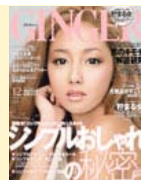
『エキゾチックなドバイへの旅』