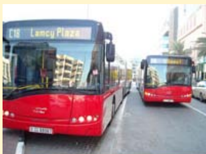
バスも新しく快適

この1日乗車チケットを利用すると、メトロの普通車、ドバイ市内バス、ウォーターバスが一日乗り放題となります。料金はお一人16ディルハム（約350円前後）とリーズナブル。購入時には、メトロ、市バス、ウォーターバスが利用できる1日チケットであることをご確認ください。（メトロ&バスをみの1日乗車チケットは、14ディルハム）