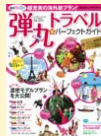
『弾丸トラベル★パーフェクトガイド』