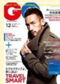
『DUBAI NOW! クールでリアルなドバイを知っているか?』