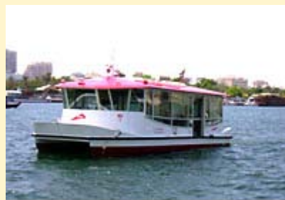
こちらはウォーターバス

ウォーターバスは、アブラ（水上タクシー）の現代版で、クリーク（入り江）を一定のスケジュール（日中は10～15分間隔）で運行しています。アブラは現金支払いのみでの乗船ですが、ウォーターバスは、この1日チケットで乗船可能です。