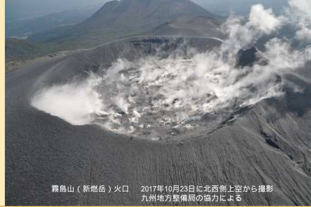
霧島山（新燃岳）火口 2017年10月23日に北西側上空から撮影