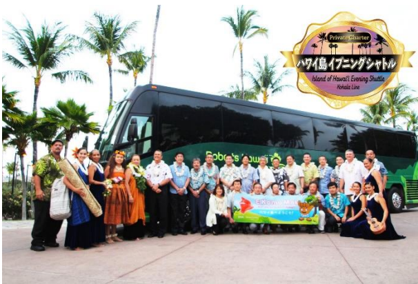
ハワイ島イブニングシャトルと関係者

ハワイ島イブニングシャトルは、参画する旅行会社7社を利用されたお客様のみを対象とし、マウナケビーチホテルとクイーンズマーケットプレイスの間を15時から22時半までの時間帯、1日3本で結ぶシャトルバスです。また同シャトルバスは、今後各社パッケージツアー商品にも組み込まれる予定です。