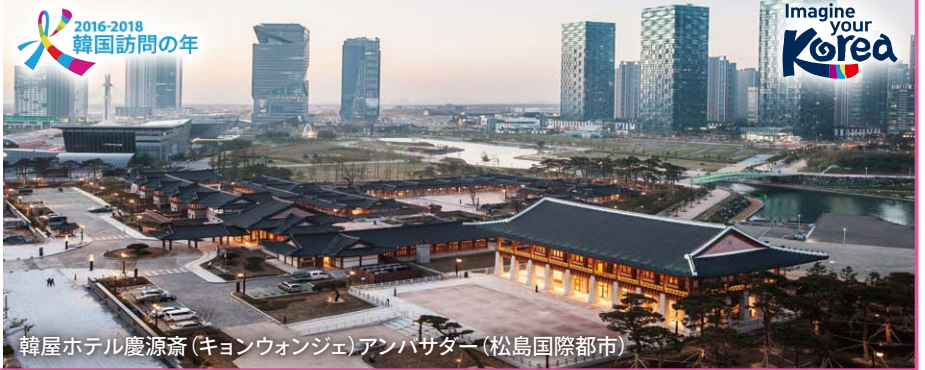
韓屋ホテル慶源齋(キョンウォンジェ)アンバサダー(松島国際都市)