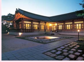
▲メイフィールドホテル 蓬萊軒