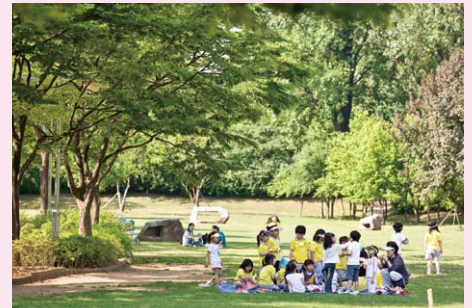
▲ソウル龍山家族公園