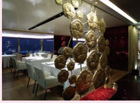
▲ロッテホテル 無窮花

韓国で一度は味わってみたい、憧れなホテルの高級韓国料理。ラグジュアリーな韓国に触れられるのも、そうしたホテルならではの魅力。その一部をご紹介します！