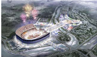
▲平昌オリンピックスタジアム イメージ

2018年2月、江原道で開催される「平昌オリンピック」。競技は平昌のみで開催されると思われがちだが、平昌郡、山間部の旌善郡、そして海沿いの江陵市の3都市で種目別に行なわれる。各競技エリア間の移動時間は平昌のアルペンシアスポーツタウンを中心に約30分、冬季オリンピック史上、最もコンパクトな競技会場の配置となる。また、ソウル市内～平昌間のアクセスは、鉄道で約1時間、高速道路で約1.5時間となり、切望される移動時間の短縮に向けたインフラの整備が進められている。