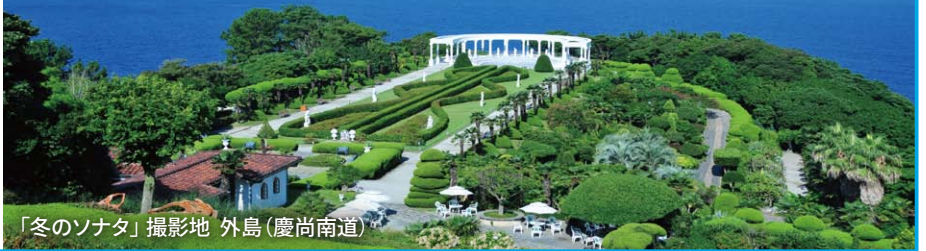
「冬のソナタ」撮影地 外島(慶尚南道)