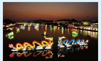
▲晋州南江流灯祭りイメージ

体験プログラムも充実しており、望みの灯籠吊るし体験、灯籠流し、国内外の灯籠展示会など多彩なコンテンツが用意されている。