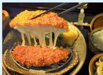
▲「チーズとんかつ」イメージ