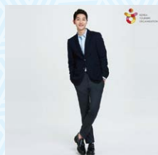
▲主人公のソン・ジュンギ (韓国観光名誉広報大使)