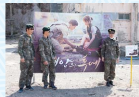
▲「キャンプ・グリーブス」イメージ