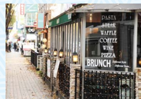
▲ドラマにも登場する「盆唐カフェ通り」イメージ