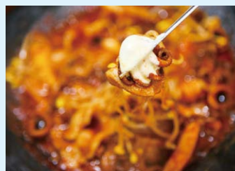
▲「チュクミフォンデュ」イメージ