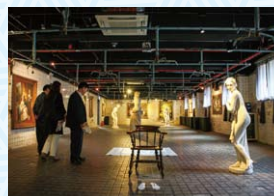
▲「三炭アートマイン」イメージ