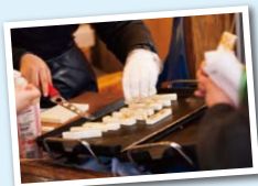
▲全州の「イムシルチーズ焼き」

チーズ料理は韓国で様々な進化を遂げ、カルビ肉にチーズを巻き付けながら食べる料理や、ホルモン焼きの上につっぱりとチーズをかけながら食べる料理、イダコのピリ辛焼きをアツアツのチーズ鍋にくぐらせて食べる、「チュクミフォンデュ」などなど、一躍ブームとなった。辛い料理が多いと言われる韓国料理だが、チーズを入れることによってマイルドになるので、辛い物が苦手な人でも気軽に食べることが出来る。