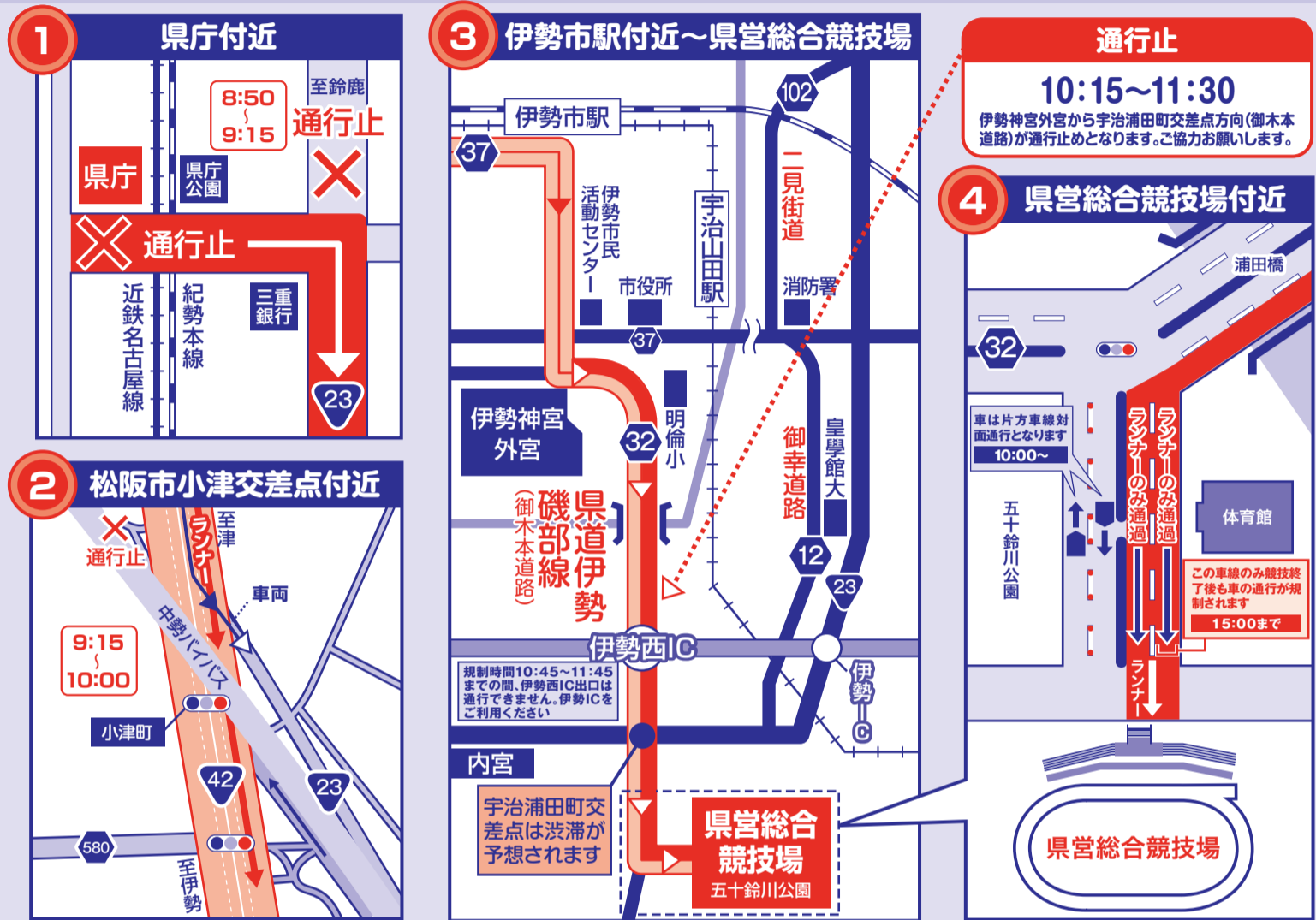
国道23号(伊勢・志摩方面)へ向かう車はご注意ください