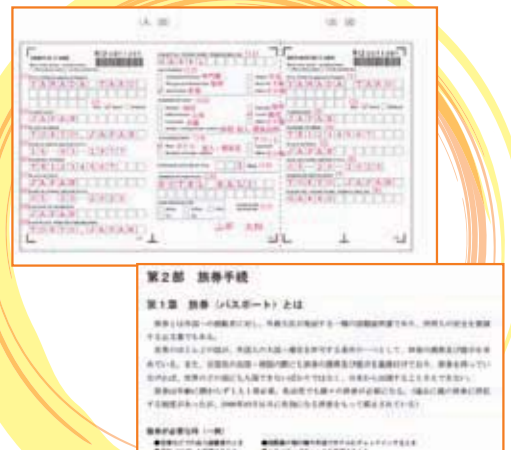
※ 渡航手続マニュアル 2013 掲載サンプルです