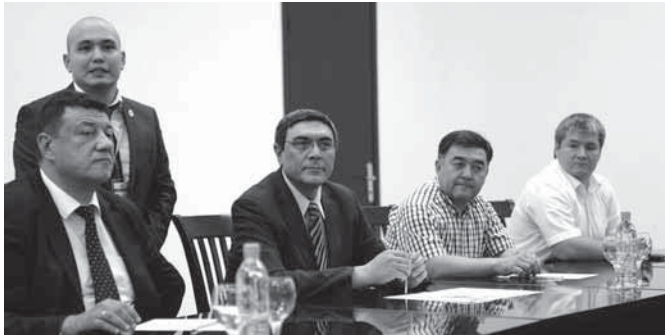
ファルフ・リザエフ ウズベキスタン観光大臣(中央)