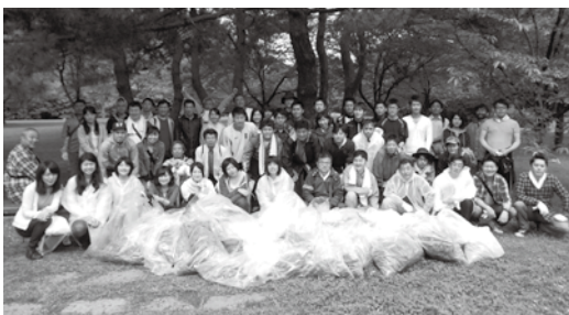
1時間余の活動で合計5000本以上を除去しました

NPO法人グリーンシティ福岡と同公園の協力で実施された活動には、55人が参加しました。NPO法人責任者による外来種植物に関するレクチャーや環境に及ぼす影響などの講習を受けた後、2チームに分かれて昨年から引き続き特定外来生物「オオキンケイギク」や「セイトカアワダチソウ」などの除去活動を行いました。