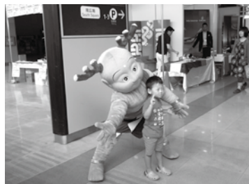
会場には平城遷都1300年のマスコット「せんとくん」も登場

5月1日 海外旅行委員会を開催。 5月22日 「関西旅博2015」プレイベント、セミナー&ワークショップを開催。