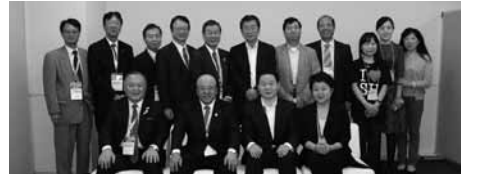
張西龍 中国国家観光局駐日本代表処首席代表(前列、田川会長の右隣)