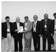
アフタブ・ウディン・サーカー バングラデシュ国会議員(中央、田川会長の右隣)