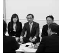
キム・ビョン・テ 韓国・ソウル観光公社社長(中央)