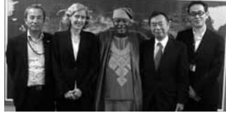
ゾマホンD.C.ルフィン ベナン大使(中央、中村理事長の左隣)