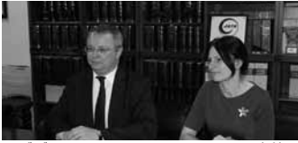
エギディウス・メイルーナス リトアニア大使(左)