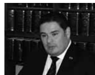
エリック・サアペドラ ポリビア大使