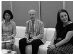
カレン・ホルバート オーストラリア政府観光局エグゼクティブ・ジェネラル・マネージャー(右)