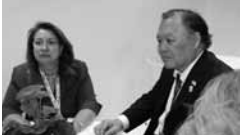
菊間副会長(右)と意見交換するイレナ・ゲオルギエヴァ ブルガリア経済・観光副大臣