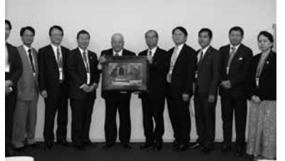
ウーティアン ミャンマーホテル観光副大臣(中央、田川会長の右隣)