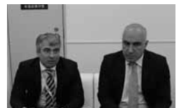
ギオルギ・チョゴヴァゼ ジョージア政府観光局会長(左)