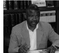
ジェイコブ・ディー・ンカテ ボツワナ大使