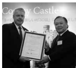
ジョーンズ首席大臣(左)に認定証を贈る菊間副会長

駐日英国大使館の大使公邸で9月10日、ウェールズ政府のカーウィン・ジョーンズ首席大臣が来日したのを記念してティム・ヒッチングス駐日英国大使主催のレセプションが開催され、席上、JATAの菊間潤吾副会長からジョーンズ首席大臣に、Team EUROPE観光促進協議会の「美しい村30選」に入ったコンウイの認定証が贈られました(写真)。