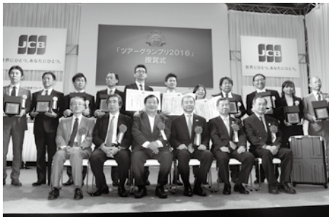
審査員とともにステージ上で記念撮影する受賞者の皆さん