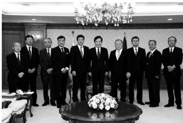
李洛淵国務総理（右から5人目）を囲む韓国訪問団