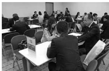
熱の入った情報交換が行われた商談会

会は、アポイントマッチング6枠とフリー商談2枠の合計8枠が用意され、対象地域が関東圏内の2県といつことも