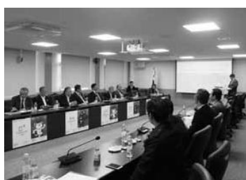
平昌オリンピック組織委員会（右側手前）から説明を受ける韓国訪問団

11月10日にソウル市内の光化門政府庁舎総理接見室で行われた李国務総理との懇談では、李国務総理が「旅行はその国に対する関心と愛の表現であり、韓日両国の交流を活性化できるように日本の旅行業界による努力をお願いしたい」と語り、「平昌冬季オリンピック・パラリンピック成功のために、韓国政府が万全の準備を行っているの