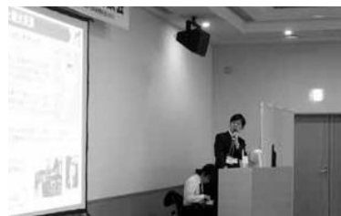
第2部で実施された地域側によるプレゼンテーション