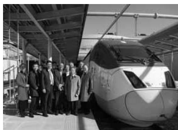
冬季五輪期間中に仁川国際空港ーソウル間開通を祝ぶKTXに貸切りで試乗