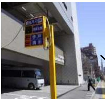
台東区民会館駐車場

当日、未予約でご来場の際には、 台東区民会館・今戸駐車場・清川駐車場の観光バス駐車場満空状況を 提供しておりますので、来場の際の参考にご利用ください。