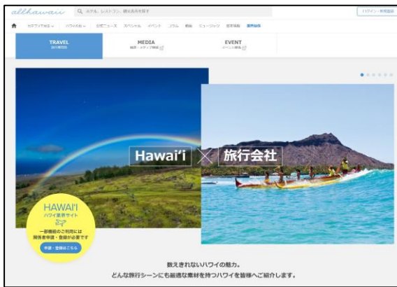
ハワイ旅行業界サイトのログイン前のトップページ

新ハワイ業界サイト： https://www.allhawaii.jp/business/