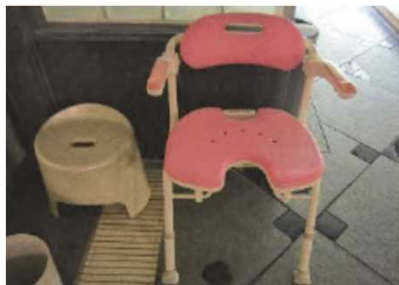
浴室用の椅子・手すり