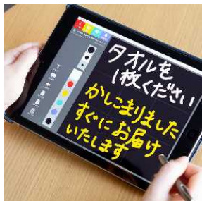
筆談用のタブレット端末