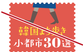
要素を減らしたり、変更しない