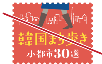
比率を変更しない