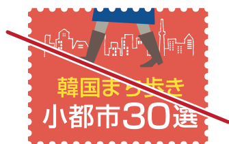
書体を変更しない