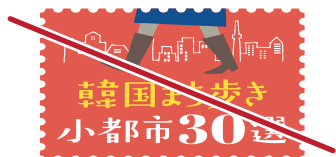
変形しない（長体・平体など）