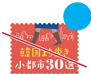
要素を追加しない