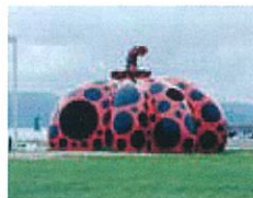
草間彌生「赤かぼちゃ」2006年 直島・宮浦港緑地