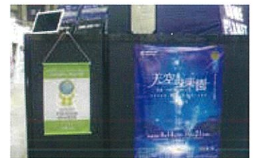
ツーリズムEXPOジャパン2018 会場内での展開例(阿智屋神観光局)