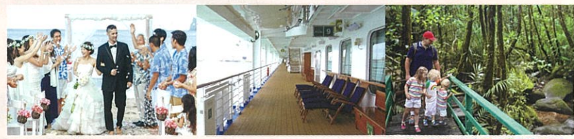
他にも様々な企画が盛りだくさん!

当日は大変混み合いますので、前売り券をご購入のうえご来場ください。(7月29日発売予定)