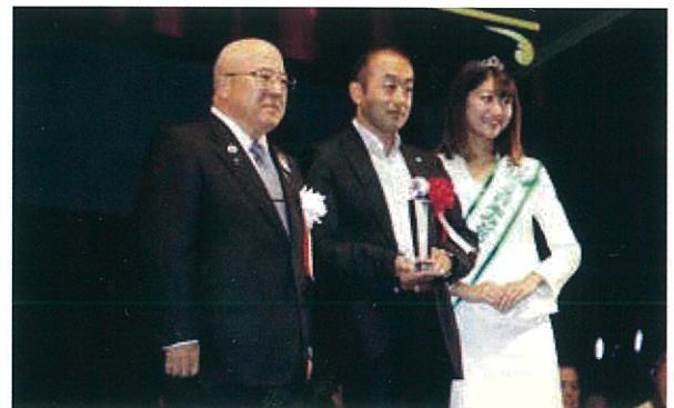
(表彰風景 左:田川ツーリズムEXPOジャパン実行委員長 中央:井口氏 右:ミス日本)