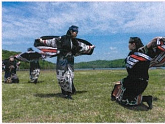
アイヌ古式舞踊(ユネスコ無形文化遺産) 短編映像上映「カムイユカラ」