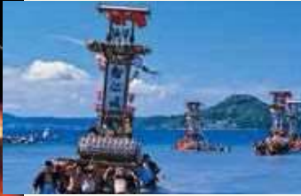
穴水町の「沖波大漁祭り」ではキリコが海へ