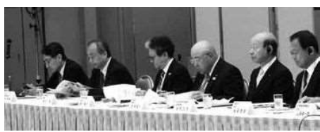
第12回日台観光サミットに出席した日本側関係者

JATAと日本観光振興協会、台湾観光協会は5月23日から26日までの4日間にわたり、富山市で「第12回日台観光サミット in 富山2019」を開催しました。「均衡ある日台双方向交流を目指して」をテーマに掲げた同サミットには、日本側から田川博己会長、日観振の山西健二郎会長、観光庁の本保芳明参与、日本政府観光局（JNTO）の蜷川彰理事、富山県の石井隆一知事をはじめ、旅行業界や運輸・宿泊業界、地方自治体などの関係者127人が参加。台湾側からは台湾観光協会の葉菊蘭会長など79人が参加しています。同サミットでは、