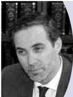
マーティン・ニデガー スイス政府観光局局長 (5月20日・志村理事長を訪問)