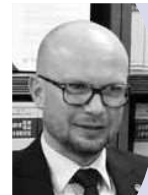
ヤコブ・マズル ポーランド・ヴロツワフ市副市長 (2月20日・志村理事長を訪問)