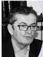
イヴ・ルクレール フランス・ノルマンディー地方観光局局長 (4月4日・JATA本部を訪問)