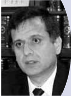
ジャロフ・ミルゾジャリフ 駐日タジキスタン大使 (4月24日・志村理事長を訪問)

出国日本人数は今年1月から4月までの累計で、前年同期比10.1%増の658万3400人を記録しました。「アウトバウンド2000万人」という目標の達成がいよいよ目前に迫ってきた日本の海外旅行市場。各国からの視線も、一層熱を帯びてきているようです。