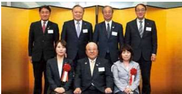
「エリア・スペシャリスト 全エリア認定賞」表彰の受賞者とJATA役員