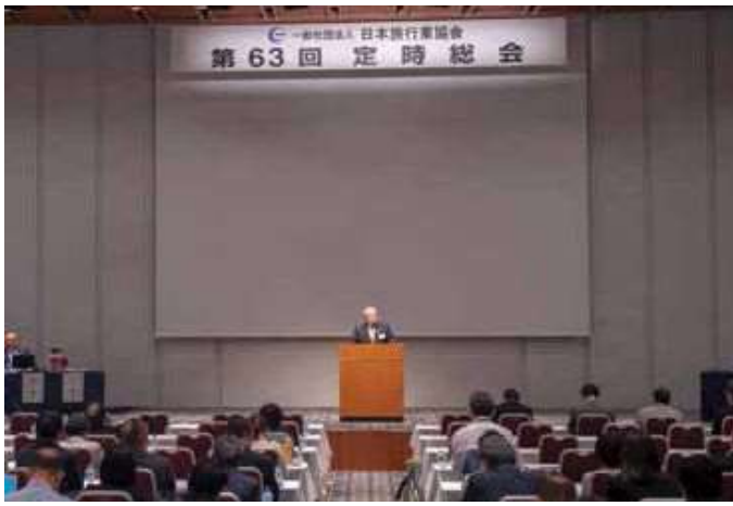
6月24日現在の正会員1194社のうち、委任状提出の会員各社と合わせて998社が出席し、第63回JATA定時総会は成立しました