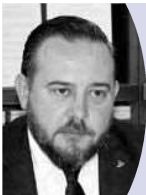
エティエン・ジャファジュ アルバニアヨーロッパ・外務副大臣 (5月21日・志村理事長を訪問)