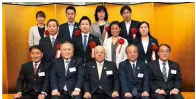
「ダイバーシティ推進部門」表彰の各社代表者とJATA役員