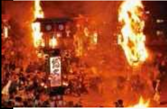
松明の中でキリコが舞う「あばれ祭」(能登町)