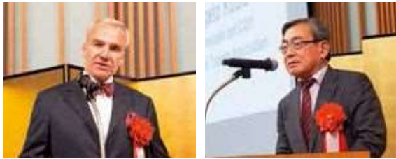
JATA定時総会後の懇親会には、石井啓一国土交通大臣(右上・右側)とイスラエルのヤッフア・ベンアリ大使(右上・左側)、自民党の二階俊博幹事長(左上・左端)、日本観光振興協会の久保茂人理事長(右下)、エストニアのヴァイノ・レイナルト大使(左下)も出席し、旅行業界への期待を示しています