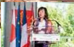
オクシタニー地方圏議会議長のデルガ氏