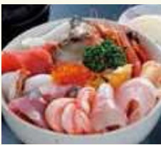
地域の味覚を生かした能登丼

一般的にはキリコと呼ばれる直方体の灯籠が、神輿とともに巡行します。重さは約2トン、高さは約15メートルに及ぶものもあり、墨書の大字や武者絵などが描かれ、漆や金箔が施されるなど、意匠は地域ごとに様々です。