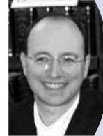
ジャン＝クリストフ・アラン フランス観光開発機構副代表 (2月1日・フレデリック・マゼンク日本代表とJATA本部を訪問)