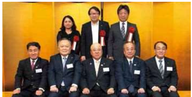
「永年勤続表彰」の受賞者とJATA役員