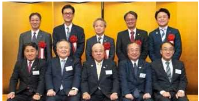
「功績表彰」(役員)の受賞者とJATA役員