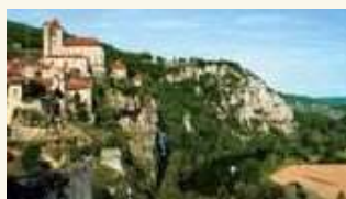
「フランスの美しい村」のひとつ、サン・シル・ラポビー