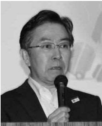
田端浩 観光庁長官

JOTCの菊間会長は、2018年に前年比6%増の1895万人と過去最高を記録した海外旅行者数が今年も1月から4月までの4カ月間で前年同期比10.1%増の658万3000人と順調に推移していると指摘。「今年も2018年と同水準の伸び率を維持すれば、われわれが目指してきた2020年にアウトバウンド2000万人達成という目標