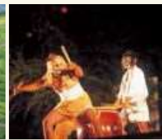
輪島市「名舟大祭」では御陣乗太鼓を奉納

輪島市の輪島キリコ会館ではキリコを担ぐ体験もできます(1週間前までに要予約)。またキリコ祭りには親戚や友人らに家に招き料理を振る舞う「ヨバレ」という風習があり、珠洲市内の協賛飲食店では、ヨバレをモチーフとした料理が味わえます。祭りのハイライトとなる夜を迎える前に「千枚田、九十九湾など、能登の原風景をご覧いただきたい」と石川県観光企画課担当。風土とともに祭りの魅力を組みこみたい素材です。