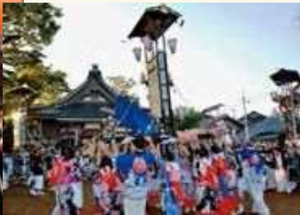
女性がキリコを担ぐ「西海祭り」(志賀町)

キリコ祭りのスタイルも多様です。七尾市の「石崎奉燈祭」は男衆の掛け声とともに色鮮やかな6基のキリコが登場します。能登町で見られるのは、松明が燃える広場でキリコが乱舞する「あばれ祭」。輪島市「輪島大祭」は、松明に付けた御幣を奪い合う重蔵神社の祭礼をはじめ、4