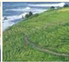
能登の名景・千枚田