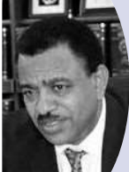
カッサ・テケレベルハン・ゲブレヒウェット 駐日エチオピア大使 (5月14日・志村理事長を訪問)