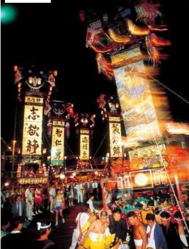
能登のキリコ祭り。ハイライトはキリコに灯りがともる夜

日本海に突き出た能登半島は古来より海上交通の要衝の一つとして様々な文化が流入し、今でも多様な民俗文化が息づいています。今回は能登の夏から秋を彩る代表的な祭礼であり、日本遺産にも認定されているキリコ祭りをご紹介します。