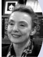
マリヤ・ペイチノビチ・プリチ クロアチア副首相兼外務大臣 (3月25日・田川会長を訪問)