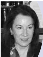
イサベル・ヒル 米国商務省ナショナルトラベル&ツーリズムオフィスディレクター (5月22日・田川会長を訪問)