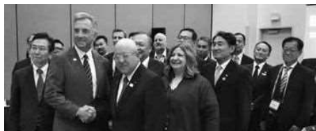
JATAとブランドUSAによる合同会議の出席者

CEOは、旅行者数・旅行消費額ともに国別で4位の日本が重要な市場であることを強調し、「安定した成熟市場である日本の旅行業界との関係を拡充し、より強固なパイプを築いていく」方針を示しています。