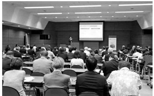
多くの関係者が参加したJOTC全体会議

日本発着の欧州線では、全日空が今年2月から羽田/ウイーン線を新規開設したのに続き、ブリティッシュ・エアウェイズも今年4月、日本航空との共同運航による関空/ロンドン(ヒースロー)線に就航。さらに、アジア線でも、ロイヤルブルネイ航空が今年3月から成田/パ