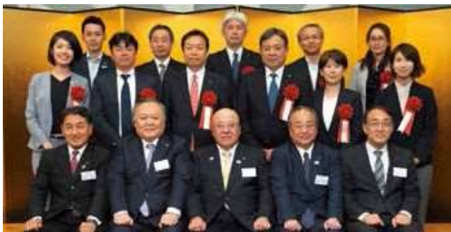
「働き方・休み方改革部門」表彰の各社代表者とJATA役員