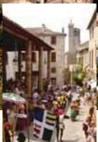
コルド・シュル・シエルでは夏に中世祭りも開かれます