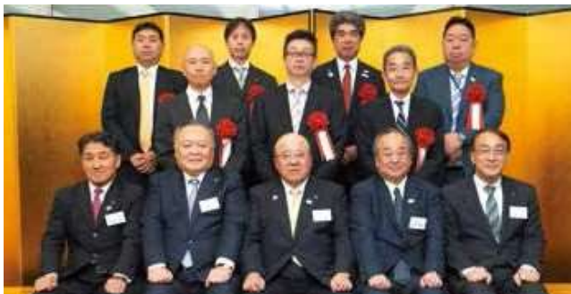
「功績表彰」(委員)の受賞者とJATA役員