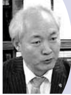
パク・ジョンハ 韓国観光公社常任理事 (3月19日・菊間副会長を訪問)