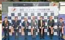
成田空港の搭乗ゲート前で行われたチャーター便運航の記念式典

コルド・シュル・シエルは世界遺産に登録されている街アルビから25キロの位置にある、日本旅行業協会(JATA)の「ヨーロッパの美しい村30選」に候補となった風光明媚な村です。オクシタニー地方観光局が推進する「特選観光スポット」のひとつとして日本市場でも積極的にプロモーションされており、ツアーに組み入れられることも次第に増えてきました。