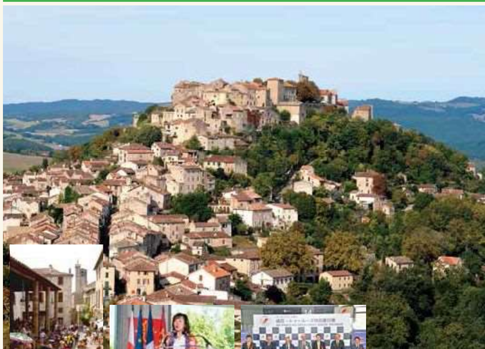
城塞の村コルド・シュル・シエル

今回は初めて日本／トゥールーズ直行便が飛んだオクシタニー地方のコルド・シュル・シエルをご紹介します。「フランスの美しい村」のひとつであるほか、同国のテレビ局が視聴者インタビュで選ぶ「フランス人の好きな村」の1位にも選ばれている、この地方有数のみどころです。