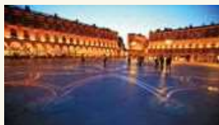
トゥールーズの中心、キャピトル広場

初のチャーター便到着を出迎えた、オクシタニー地方圏議会議長のキャロル・デルガ氏は「これまでのオクシタニー地方観光局とパートナー機関が、日本市場に向けて積み重ねた努力の結果」と讃えつつ、 「オクシタニー地方を日本市場におけるヨーロッパの主要な旅行目的地の10位以内にランクインさせる」と意欲を示しています。