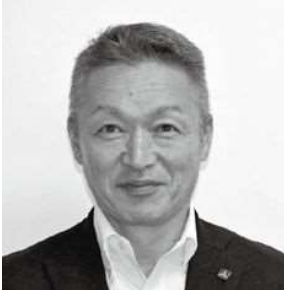
東武トップツアーズ 瀬川部長