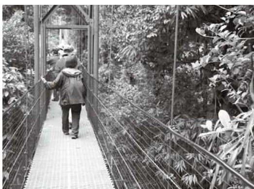
コンセプトにこだわったツアーの顧客満足度は90%以上に達しました

「2017年の春に、航空会社2社によるメキシコシティーへの新規就航と増便があり、アクセスの良くなった中米方面への商品開発に向けて7カ国を視察し、18