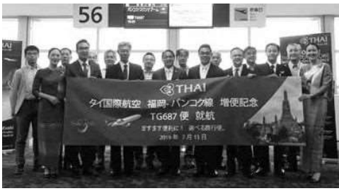
バンコクへの視察研修FAMツアーの一行

FAMツアーには、JATA関係者8人をはじめ、タイ国政府観光庁(TAT)とタイ国際航空(TG)の関係者3人などが参加し、昨年11月に開業したばかりの最新観光名所「マハナコン・スカイウォーク」やバンコクでの新しい夜の過ごし方として人気を集めているルーフトップバーなどを視察していま