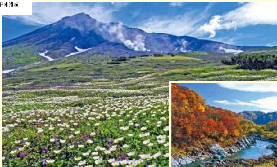
北海道最高峰の旭岳／神居古潭には神と魔人の戦いの場という伝説が残されています(右)

北海道の中央部の大雪山や、その山を水源とする石狩川が流れる上川盆地。ここには古来より先住民の上川アイヌたちが、自然を神と崇め、川を水運の道としながら暮らしてきました。今なおこの地に息づく彼らの伝統文化は2018年、日本遺産に登録されました。