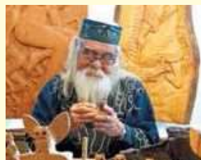
代表的な北海道土産、木彫りの熊はアイヌの民芸細工