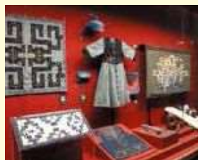
旭川市博物館にもアイヌに関する展示があります