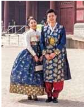
若年層にも人気の高い韓服体験 (写真はイメージです)

ト調査では、「治安が心配である」「言葉に不安がある」「費用がかりすぎる」といった項目が海外旅行の阻害要因として高い割合を示しており、特に、若年層で「治安」「言葉」「費用」を理由に海外旅行を躊躇する傾向が強いことから、「ハタチの二歩」プロジェクトで初めて海外旅行を経験する若者たちが、SNSなどによる波及効果も期待されることです。