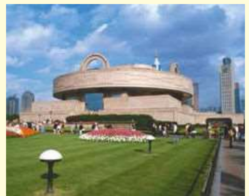
「ハタチの一歩」では博物館のボランティア活動も(写真は上海博物館)

と日本に懸け橋をつくる『使者』とも言えるわけで、心から応援したい」と語り、同プロジェクトを全面的にサポートする考えを表明。「自ら中国での海外体験を希望した若者の皆さんに感謝すると同時に、20歳で経験する『中国の今』をしっかりと心に刻んでいた