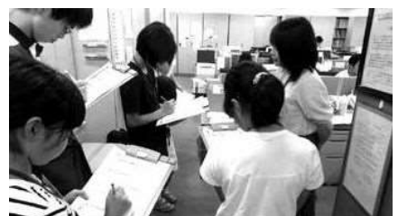
社員の説明を真剣に聞き、メモを取る子どもたち(子ども参観日)