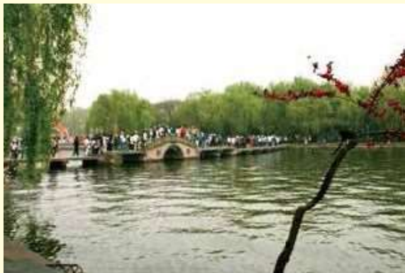
西湖の湖畔を中国の学生たちと語りながら歩く「ふれあいウォーク」

中国でも実施されます。中日青少年交流促進年と定められた2019年を象徴するイベントとして、青少年交流を加速させる「ハタチの一步」による「杭州・上海5日間」プロジェクトへの期待が高まっています。