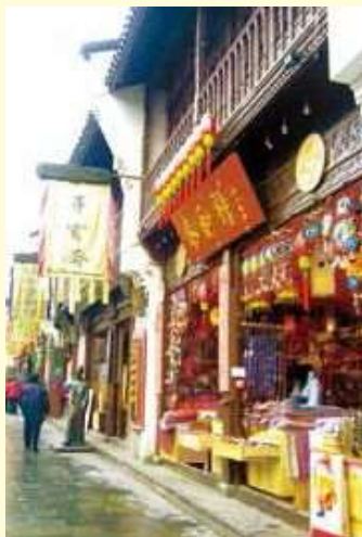
南宋時代の街並みが再現された河坊街(杭州)

ANA 杭州線就航15周年記念とも銘打たれた「杭州・西湖ふれあいウォーク」は、中国での「ハタチの一步」20歳初めての海外体験プロジェクトを企画実施するANAセールスが