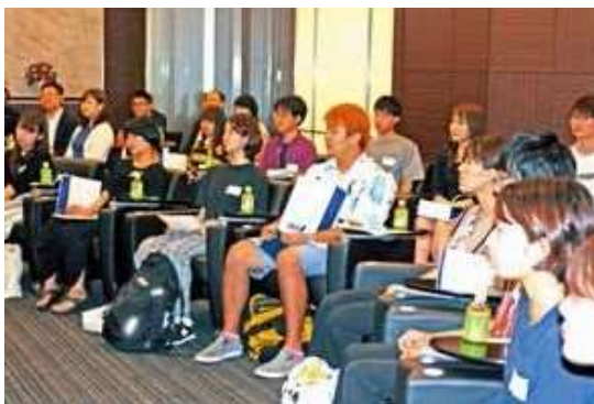
中国で実施される「ハタチの一步」プロジェクトの説明に耳を傾ける参加者の皆さん

観光庁、文部科学省、外務省、経済産業省の中央省庁をはじめ、日本修学旅行協会や日本経団連連合会などの各種関係団体とJATA、全国旅行業協会