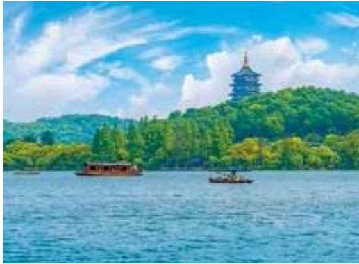
杭州観光の定番・西湖は、体験プロジェクトでも目玉の一つ