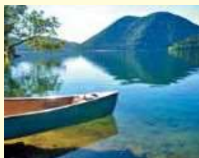
然別湖には固有種のおしほこまが棲息