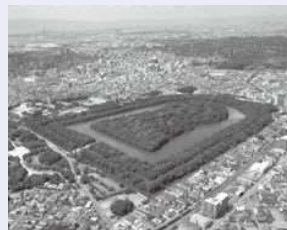
街道沿いにある世界遺産の仁徳天皇陵古墳