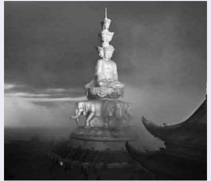
中国四大仏教聖地と中国三大霊山の一つに数えられる「峨眉山」