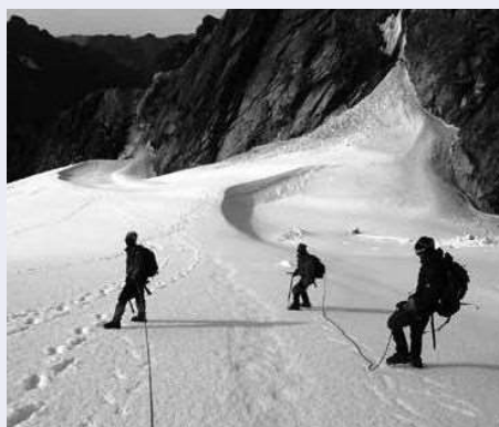
ルウェンゾリ山地