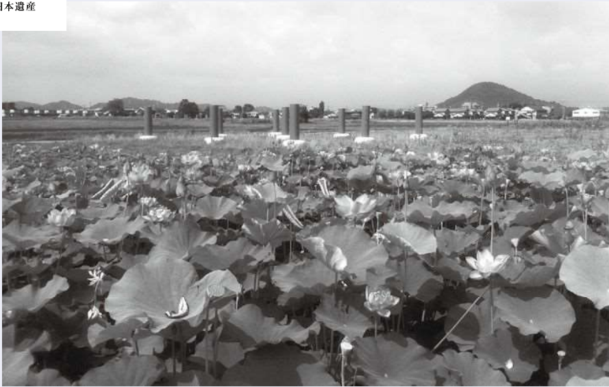
藤原宮の大極殿跡南東の蓮池は約3000平方メートル。11種の蓮が栽培され、7～8月が見ごろです。

竹内街道・横大路(大道)は大阪から奈良までの約40キロにわたる日本最古の国道。女帝・推古天皇の時代である613年に制定されたこの道は、以後1400年以上にわたって歴史や文化を育み、2017年に日本遺産に認定されました。