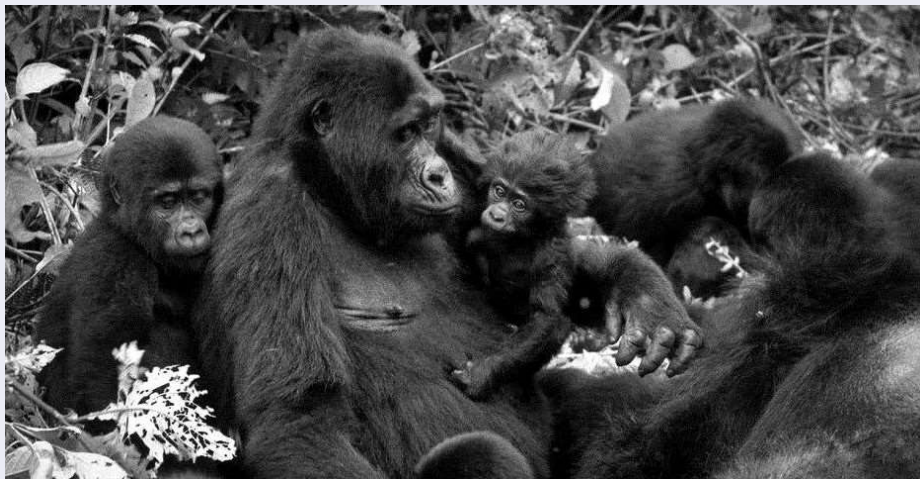
マウンテンゴリラ

「その大きさ、さまざまな形と色、鳥、昆虫、爬虫類、動物などの華々しい生き物、広大なスケール——ウガンダはまさに『アフリカの真珠』である。」と元イギリス首相、ウィンストン・チャーチルは推奨しています。