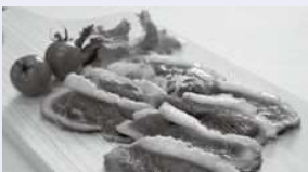
松原市の河内鴨は街道上の新たな味覚

この道は7世紀、大阪府の難波津と当時政治の中心地、奈良県の飛鳥・小墾田宮を結ぶ「大道」として整備され、ここを通して朝鮮半島や中国からの外交使節や遣隋使・遣唐使が往来し、大陸の文化や仏教が伝わりました。中世には自由都市・堺と大和を結ぶ経済路に、江戸時代には伊勢参りの旅路となるなど、1400年余の時間が息づきます。 「活動の第2段階。街道上の隠れた観光素材にはスポットを当て、すでに有名な観光素材には街道という切り口を付与できるところに価値がある」と実行委員会。今後は「旅行会社との連携や商品化も課題の一つ」としてさらなる発展・展開を視野に入れていきます。