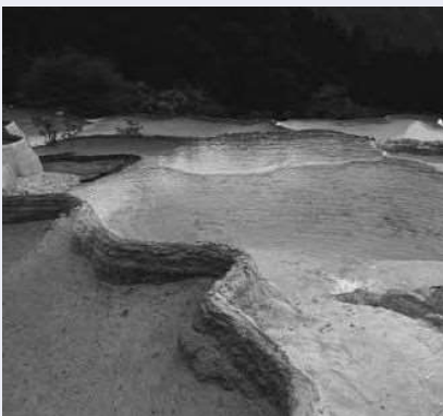
小池が連のように並ぶ黄龍は「この世の仙境」と称えられます

3月末には、感染者の急減を 踏まえてジムやインターネットカ フェの再開が許可されるなど、中 国国内でもいち早く市民生活の