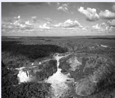
マーチソン・フォールズ