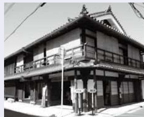
橿原市の八木札の辻は日本最古の国道交差点といわれます