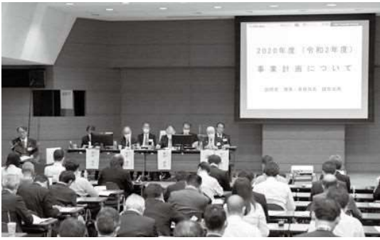
6月22日現在のJATA正会員数は1196社。委任状を含めた出席は947社で、総会は適法に成立しました