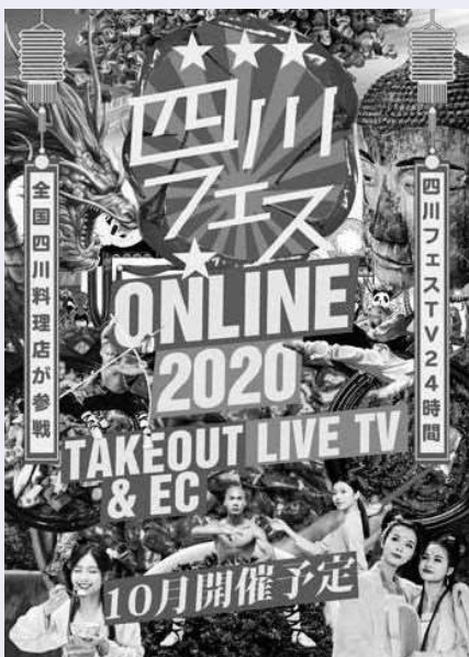
四川料理ファンの注目と期待を集める「四川フェス」