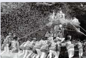
太子町科長神社の夏祭り。曳行される地車のなかには府内では珍しい船形のものも