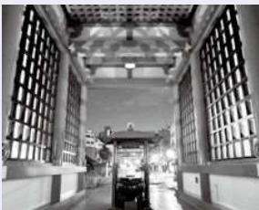
聖徳太子ゆかりの四天王寺