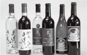
実は大阪の河内地域はブドウの産地。羽曳野市ではワインが作られています