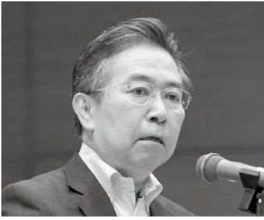
田端浩 観光庁長官