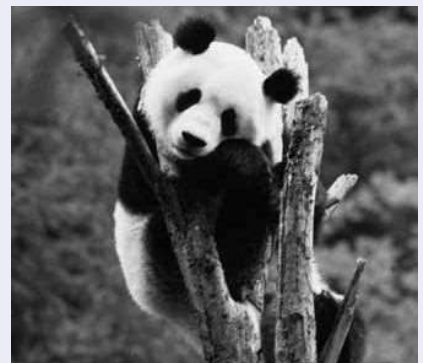
初来日から半世紀を経て中日交流の象徴であり続ける パンダ

その驚くべき水の透明度は、岩 に含まれるカルシウムの作用によ るものと言われており、鏡のよう に光を反射して輝く水面の美し さは息を呑むばかりで、「神話の