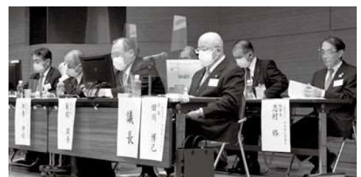
壇上の議長席には透明の衝立が設置され、フェースシールドを装着した理事の姿も