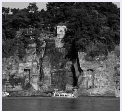
弥勒菩薩を模った世界最大の石刻大仏である「樂山大仏」