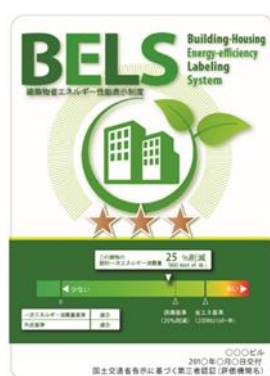
[図1] ガイドラインに基づく第三者認証の例

消費者への認知度向上を図るため、ZEHビルダー/プランナーをはじめとするZEHに関係する事業者は、インターネットやテレビ、雑誌等の広報媒体を介して、ZEHマーク[図2]とともに光熱費低減やヒートショック関連の健康リスクの低減といったZEHのメリットを積極的に発信すること。