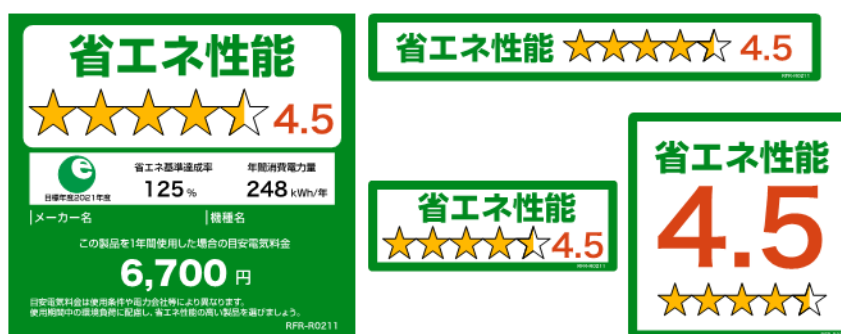
(冷蔵庫のイメージ)

※ 家庭用電気冷蔵庫、家庭用電気冷凍庫、照明器具及び電気便座については、2020年11月に上記様式に変更済。今後、家庭用エアコンディショナー、テレビジョン受信機、温水機器（ガス温水機器、石油温水機器、電気温水機器）についても上記様式に倣ったものに変更予定。