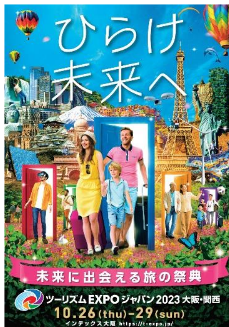
「ツーリズム EXPO ジャパン 2023 大阪・関西」

2023 年は、新型コロナウイルス感染症を乗り越え観光産業が本格的に再始動を始めています。「ツーリズム EXPO ジャパン 2023 大阪・関西」では、本格的に再始動を始めた観光産業を後押しし、2025 年大阪・関西万博やその後の世界から注目を集める大型事業へつなぐ世界最大級の総合観光イベントとして様々な情報発信を行います。