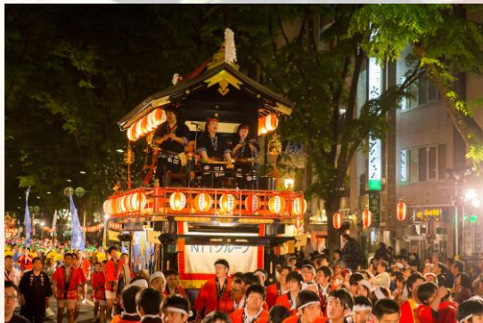
画像：提灯に浮かび上がる「山鉾」がまつりを彩る

土曜日に開催されるのが「宵まつり」。この日は街中にお囃子が鳴り響き、仙台すずめ踊りが演舞されます。杜の都を代表するケヤキ並木の定禅寺通をはじめ、個性豊かな商店が軒を連ねるアーケード街などで仙台すずめ踊りが披露されます。また、東日本大震災の翌年・2012年からは、早期の震災復興を願い、復興祈願山鉾が宵まつりに参加。提灯に浮かび上がる山鉾がまつりに幻想的な美しさを加えています。