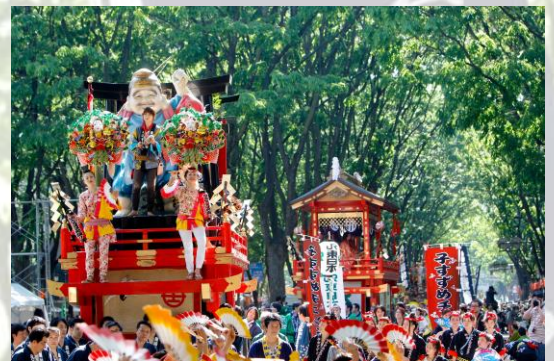
画像：新緑の中巡行する「山鉾」

日曜日に行われる「本まつり」では、仙台・青葉まつりの最大の見どころである「時代絵巻巡行」が行なわれ、藩政時代の活気と華やかさを表現した時代絵巻が練り広げられます。騎乗の政宗公率いる甲冑姿の武者隊、鉄砲隊など戦国絵巻を再現した政宗公本陣の行列、伊達政宗公を祀る青葉神社の神輿渡御に稚児行列、豪華絢爛11基の仙台山鉾巡行、仙台すずめ踊りの大流しが練り広げられ、悠久の城下町・仙台を再現します。