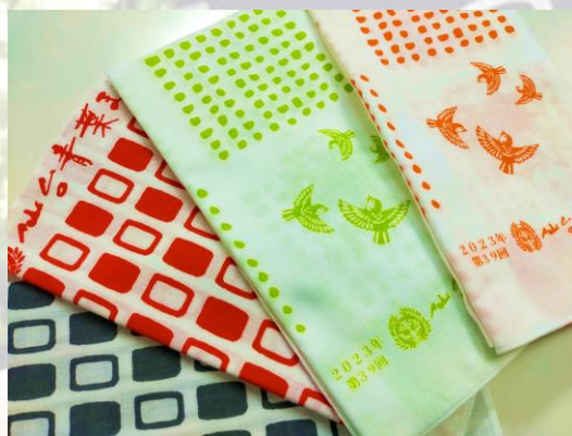
画像：オリジナル手ぬぐいのイメージ