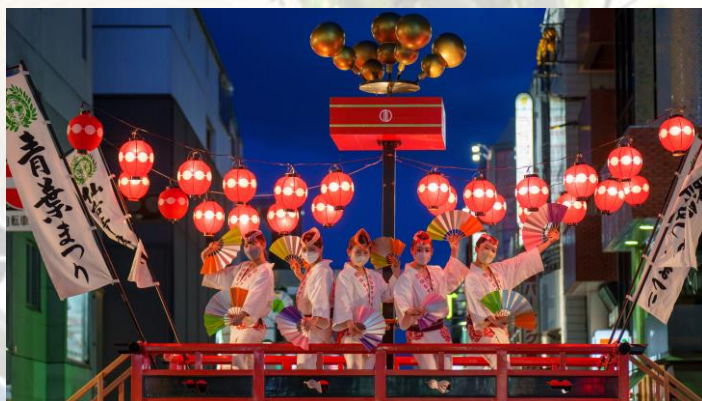
画像：SS席付近に設置する「すずめ山車」では記念撮影や乗車し、まつりをお楽しみいただけます。