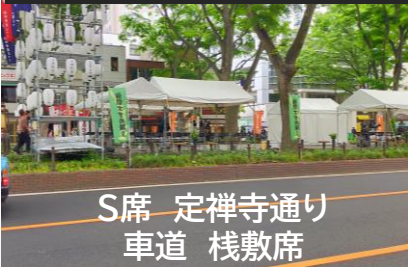
画像は車道席からの景色イメージです