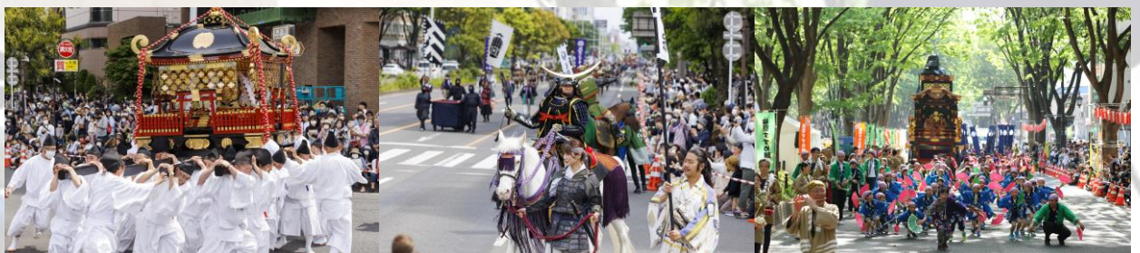
画像：本まつりを代表する「時代絵巻巡行」江戸時代の豪華絢爛なまつりが現代的に再現される