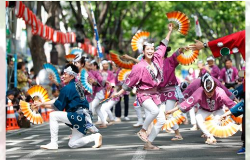
画像：大迫力のすずめ踊りが演舞される

「仙台すずめ踊り」は、伊達政宗公の前で仙台城を築城した石工たちが即興で披露した踊りに始まると言われ、躍動感あふれる身振りや手ぶり、跳ね踊る姿がすずめの姿に似ていることなどから、「すずめ踊り」と呼ばれ、地域の人々に長く親しまれてきました。仙台・青葉まつりは、地元の人々はもちろん、全国から多くの観光客が訪れる大人気の祭りです。