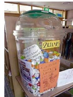
発展途上国のワクチン代に ペットボトルのキャップを回収 (滋賀・豊郷町立豊郷小学校)