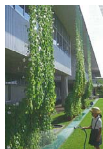
代々ゆずり受けた種から育てたアサガオのグリーンカーテン (広島・なぎさ公園小学校)