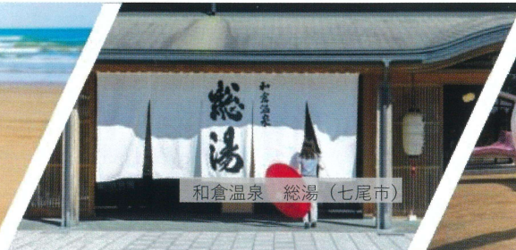
和倉温泉 総湯 (七尾市)