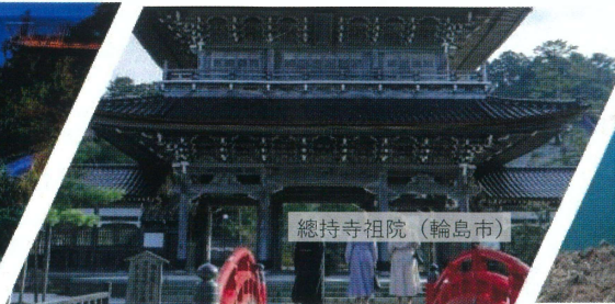
総持寺祖院 (輪島市)