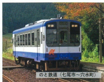
のと鉄道 (七尾市～穴水町)