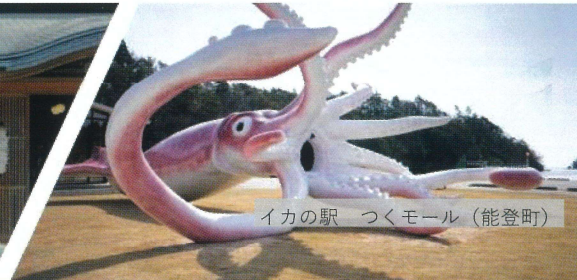
イカの駅 つくモール (能登町)

令和6年元日に発生した能登半島地震では、 石川県能登地域は甚大な被害を受けました。 多くの方のご支援により少しずつ復興に向けて歩みを進めています。