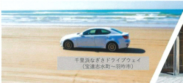
千里浜なぎさドライブウェイ (宝達志水町～羽咋市)