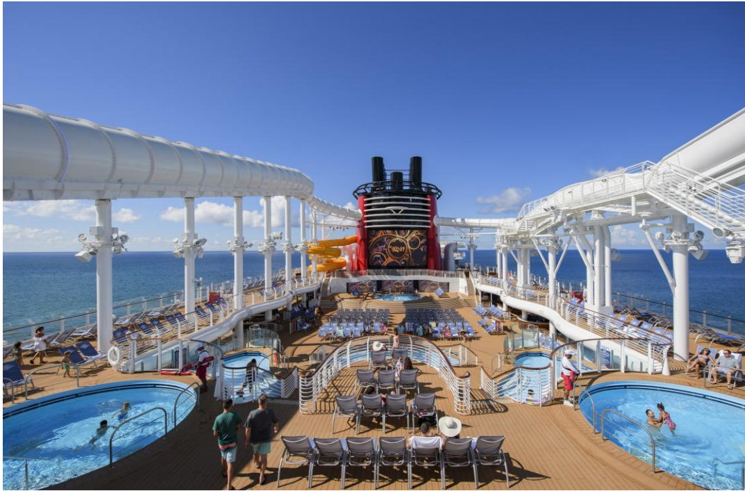
アクアマウス ウォータースライダー