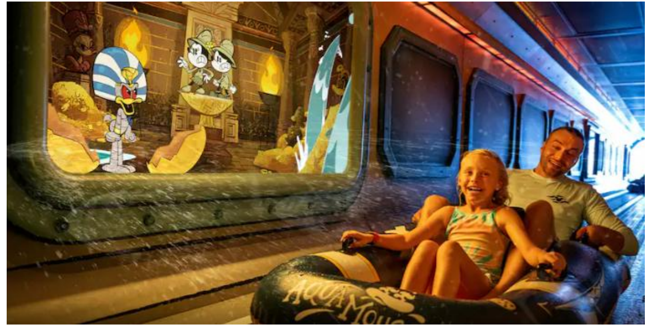
アクアマウス ウォータースライダー