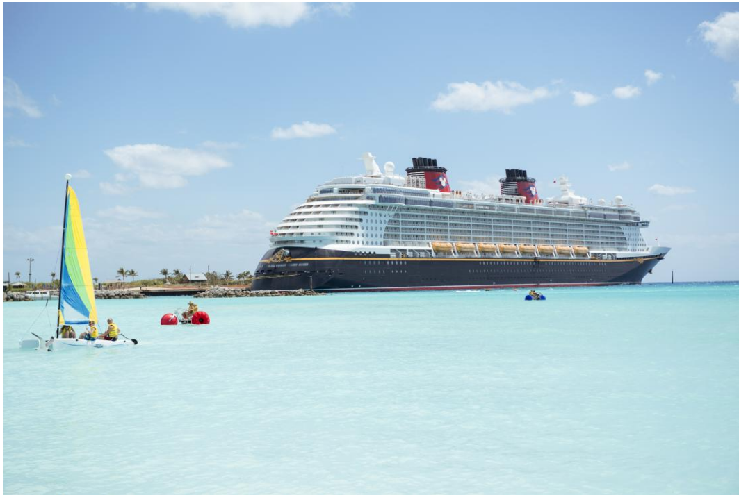
ディズニー・キャストウェイ・ケイ