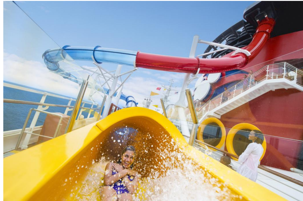
ウォータースライダー「アクアダンク」