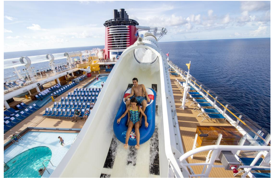
アクアダック ウォータースライダー