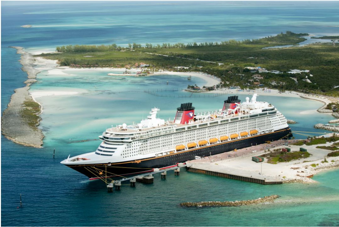
ディズニー・キャストウェイ・ケイ