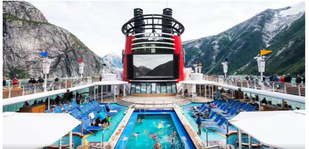
デッキプール「グーフィープール」