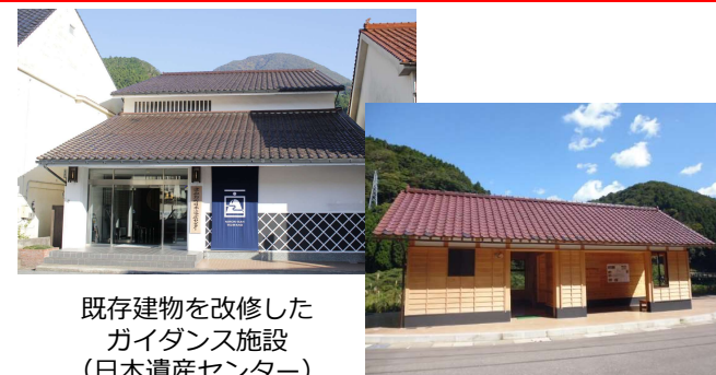
既存建物を改修した ガイダンス施設 （日本遺産センター）