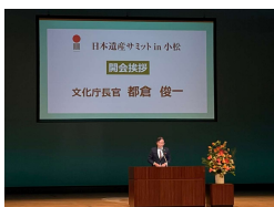
（昨年度のフェスティバルの様子）