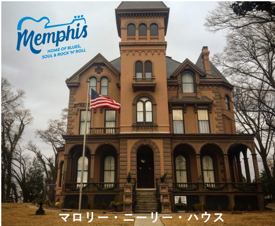
マローリー・ニーリー・ハウス

Memphis HOME OF BLUES, SOUL & ROCK 'N' ROLL