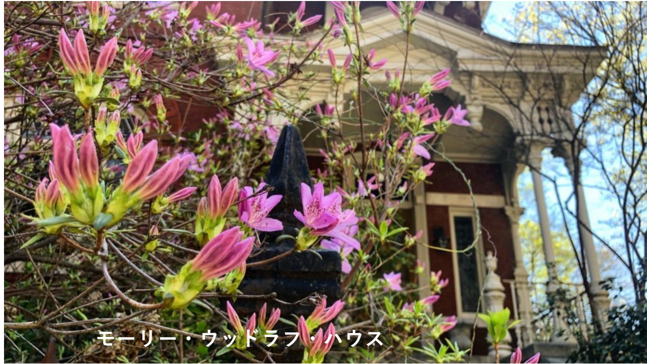
モーリー・ウッドラフ・ハウス