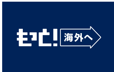
バックが濃い色やロゴ指定色に近い色の場合