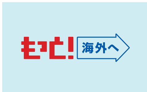
バックが淡い色の場合