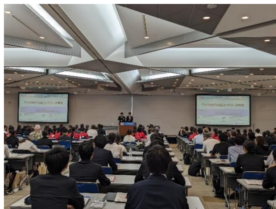
<当日の会場での発表の様子>