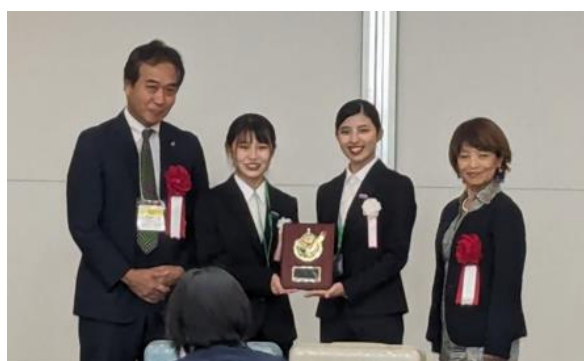
<準グランプリ（跡見学園女子大学 篠原ゼミ）>